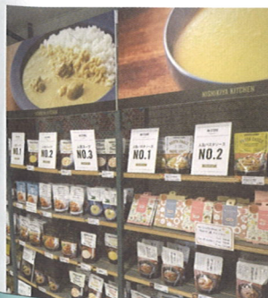
▼書店のレトルトフード棚

ころだ。料理やお店についての本、すなわち「知の食欲」との連動あるいは酒の本との連携配架でこそ、書店内でのフード販売は相乗効果が期待できるだろうに。せめてレトルトパックに小冊子をつけてご家庭で味を再現するためのレシピを載せればいいのに。